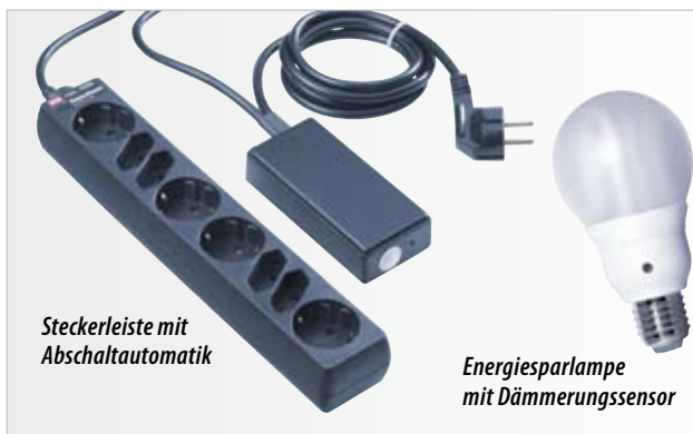
Steckerleiste mit Abschaltautomatik

Schaltstellen. Eine Steckerleiste mit Schalter trennt mehrere Geräte auf einmal vom Netz, etwa TV, DVD-Player und Stereoanlage. Allerdings muss die Energieversorgung „zu Fuß“ wieder hergestellt werden, ehe sich die Komponenten per Fernbedienung aktivieren lassen. Leisten mit Abschaltautomatik sind schlauer: Sie erkennen am nachlassenden Strom-